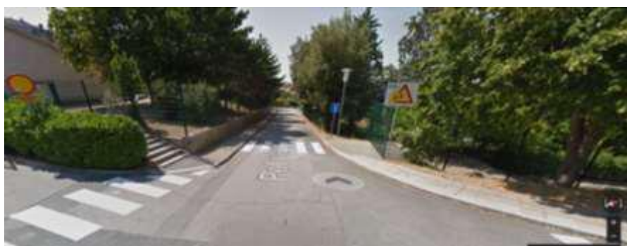
Pot v gaj