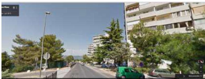
Ulica Vena Piona