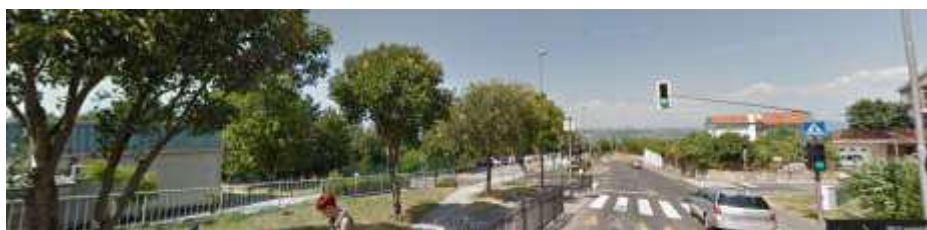
Ulica Vena Piona – križišče pred šolo in semaforiziran prehod za pešce s talno oviro za umirjanje prometa.